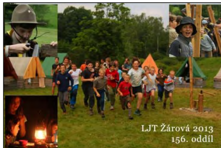
LJT Žárová 2013 156. oddíl

V minulém čísle jsem na úvod psal o letošním táboře. O svém očekávání a tom, co nás čeká. Tábor je pryč a s tím přichází skoro dvouměsíční pauza v činnosti našeho oddílu. Je to ale jen pauza v dětském programu nikoli pauza ve skautingu jako takovém. Co se vlastně v této "pauze" děje?